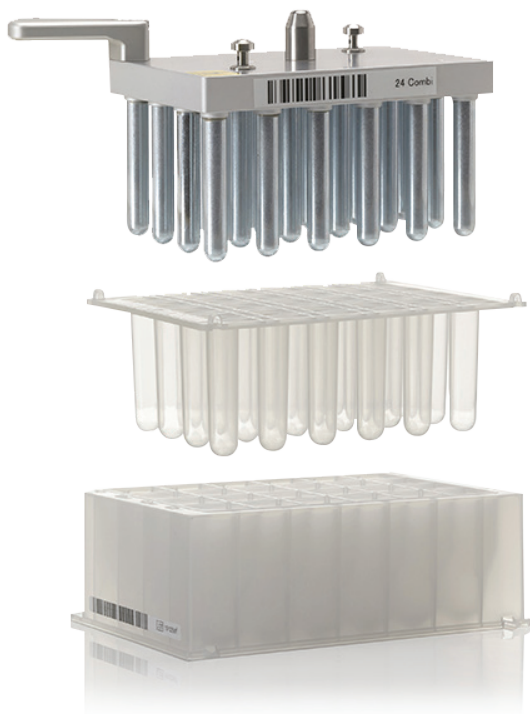
24深孔板 30–5,000 \mu\text{L}